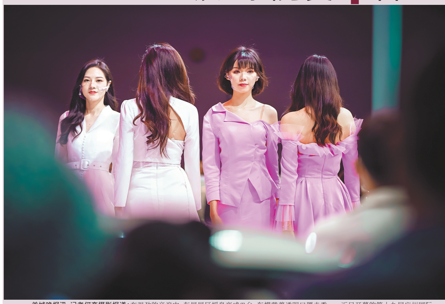
羊城晚报讯 记者何奔摄影报道:在强劲的音浪中,车展展区摇身变成T台,车模戴着透明口罩走秀……近日开幕的第十九届广州国际车展上,众多精彩看点让人目不暇给。其中,某国产汽车品牌的芭蕾舞剧启幕,三幕大剧璀璨上演,“喵星”成为车展最闪耀的舞台。