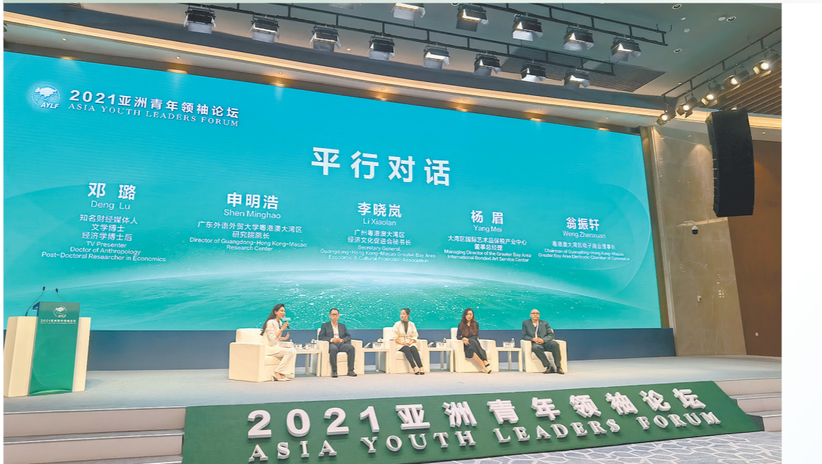
来自粤港澳的青年领袖畅谈粤港澳大湾区合作发展所带来的机遇与挑战

2021亚洲青年领袖论坛在28日举行“粤港澳大湾区合作发展论坛”，来自粤港澳的青年领袖们畅谈粤港澳大湾区合作发展所带来的机遇与挑战。那么，当代青年究竟能在粤港澳大湾区迎来哪些新机遇呢?