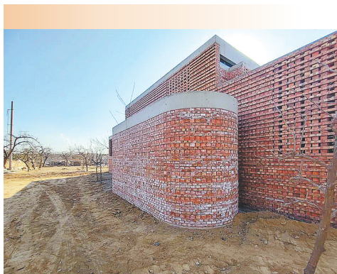
外墙出现返碱现象