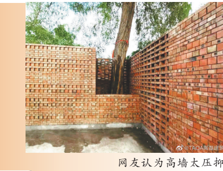
网友认为高墙太压抑