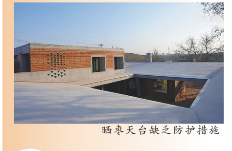
晒太阳台缺乏防护措施