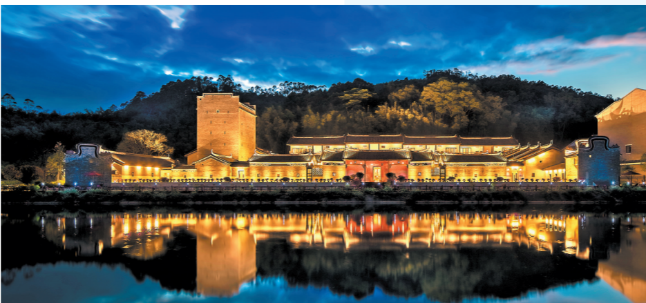
环境是消费者对民宿体验的价值驱动点 图为增城吾乡石屋民宿

重要途径,在乡村全面振兴中发挥着整合示范作用。在此过程中,拓展“民宿+N”尤为关键,尤其是广州这样的大都市周边的民宿,更应与文创、商业、教育、娱乐等不断“相加”,持续创新乡村民宿旅游业态。