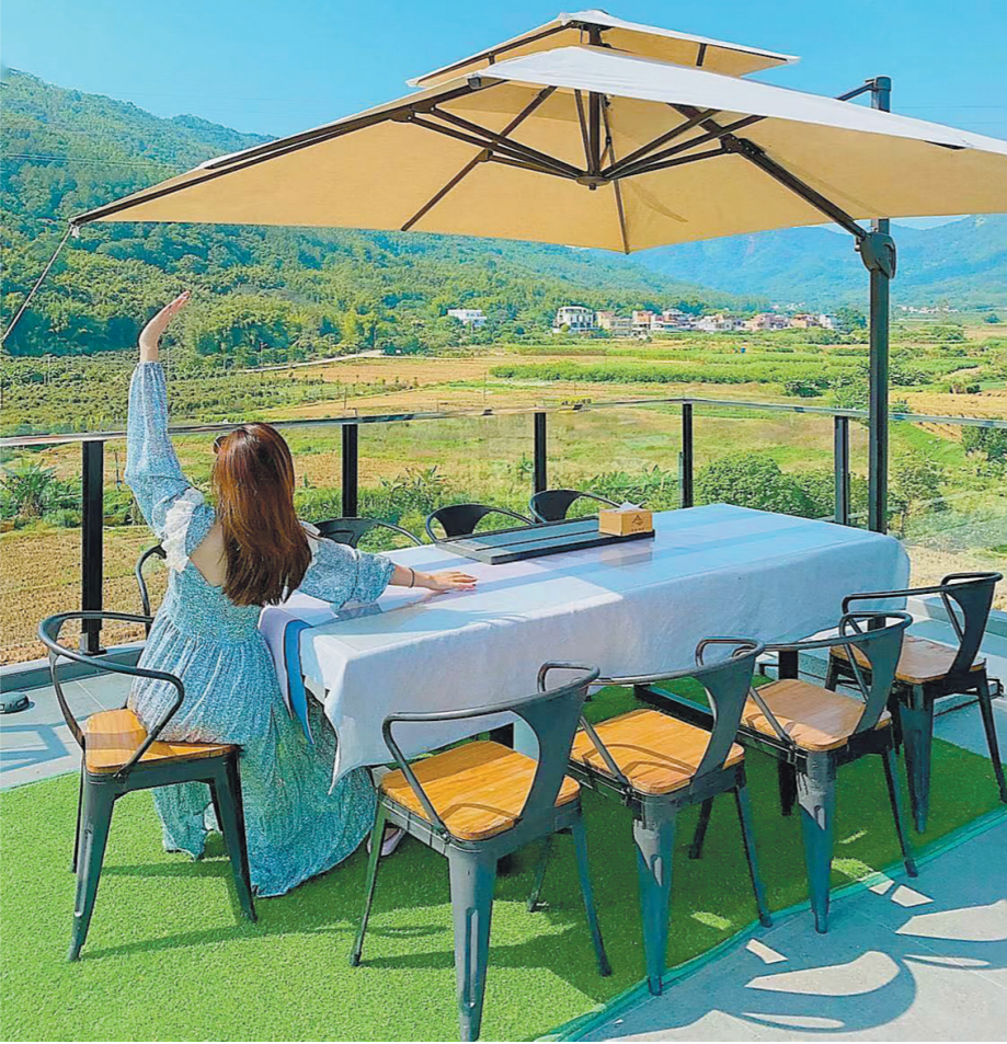
乡村旅游民宿已成为城市居民日渐常态化的假日休闲度假场景,图为探云田居民宿

据了解,基于独有的区位优势及地域文化色彩,广州周边的乡村民宿发展逐渐显现出独具特色的精品化、个性化发展趋势,并不乏新的探索与尝试。此次会议中,与会人士就未来的广州民宿发展路径提出了建议。