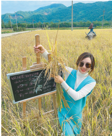
砍甘蔗、割水稻,探云田居民宿的多彩乡村生活