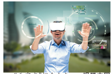
“元宇宙”概念大火

其实,在“元宇宙”概念成为网络热词之前,其基本元素已经存在很久。但这个已经存在近30年,从科幻小说中诞生的词汇,此前并没有引起大众的广泛关注。准确地说,“元宇宙”不是一个新的概念,它更像是一个经典概念的重生,是在扩展现实(XR)、区块链、云计算、数