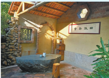
田缘花舍民宿的独立小院

重要途径,在乡村全面振兴中发挥着整合示范作用。在此过程中,拓展“民宿+N”尤为关键,尤其是广州这样的大都市周边的民宿,更应与文创、商业、教育、娱乐等不断“相加”,持续创新乡村民宿旅游业态。