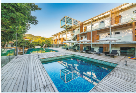
好客精品民宿泳池

专业设计大师由废弃校舍精心改造而成的仿古风格民宿建筑,其目标是打造最美的花园民宿第一品牌。 地址:广州市从化区鳌头镇西塘村