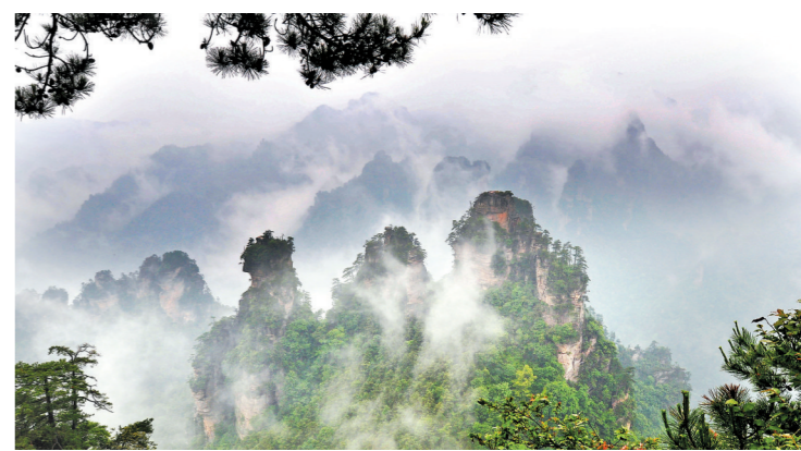
雨中的奇境张家界

字孪生等新技术下的概念具化。到了今年,中国行业巨头腾讯、百度等企业在先后宣布进入元宇宙领域,相关概念也在文旅行业成为股市热点和公司宣传噱头。10月底,国外著名网络科技公司“facebook”(脸书)改名为“Meta”(元),据称,这一战略举措的核心就是大力投资元宇宙——Metaverse。这对“元宇宙”概念的迅速普及推广起到了推波助澜的大作用。世界文旅巨头迪士尼公司最近也提到,迪士尼将建立自己的“元宇宙”,将现实与虚拟世界更加紧密地连接起来,跨越边界,打造更多IP故事。