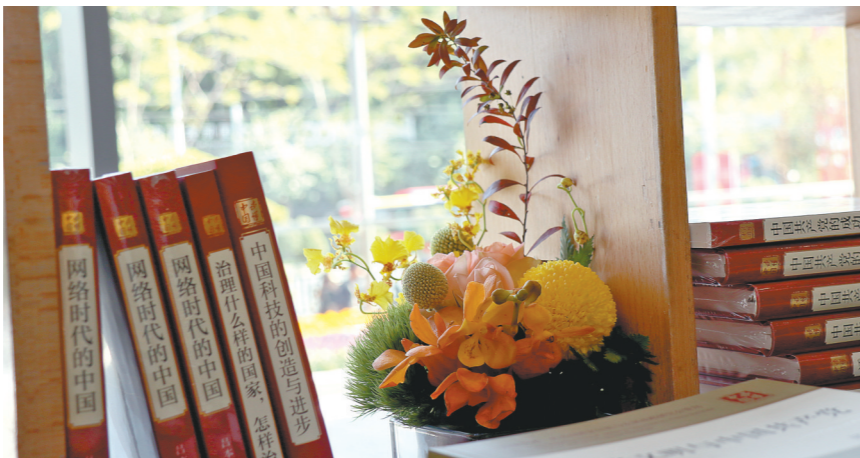
“读懂中国”国际会议主会场设置的书籍展台

在主会场一楼一座庄重大气的艺术装置也格外吸引人。这个装置由高低错落的三款白色方形花箱组合而成,寓意国家稳固、安宁、稳步上升的美好愿景。白色则代表着中国坚持保持纯洁真诚的合作姿态、向世界敞开