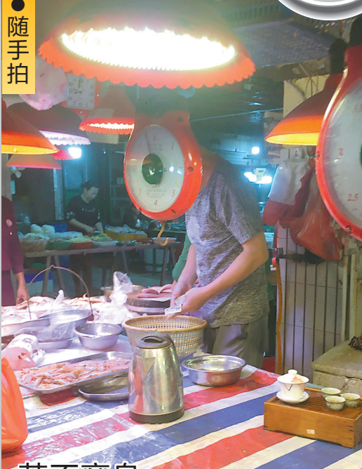
茶不离身

董其昌成名颇晚,三十多岁才中举,正式进入官场。开始也有所抱负,不久,不知何由,却似乎看破了红尘,不事上进。不过,他身历晚明五朝,却