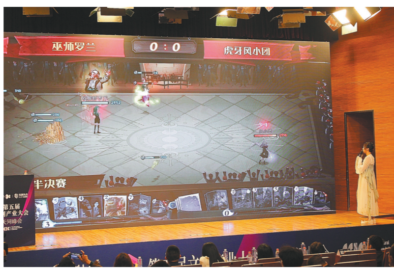
参赛者普遍年轻,多为在校大学生