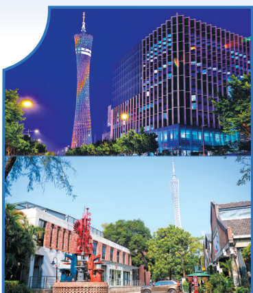
中国(广州)超高清视频创新产业园区

他介绍,目前,花山小镇进驻企业机构近30家,开设经营的业态有书画展览、文创设计、工业设计、影视制作、陶瓷香道、艺术培训等;还有特色中西餐、红酒咖啡、乡村民宿(业已经营的民宿有3家)等特色经营商户。在大力引进多种业态的同时,小镇注重对碉楼古建筑的保护、修缮和利用,保留古村落原生态,形成新旧村民和谐共处的景象。