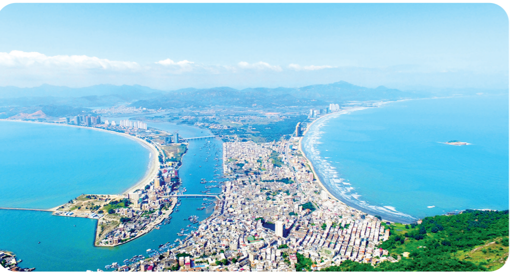
滨海旅游度假区双月湾

同时,以京港高铁赣深段为重要纽带,惠州积极参与大湾区综合性国家科学中心建设,高标准建设潼湖生态智慧区等重大创新平台。加强与广深港澳开展能源、新材料、生命科学基础研究和应用基础研究合作,联合澳门中药质量研究国家重点实验室共建中医药实验室,努力打造国家级能源科技创新中心。