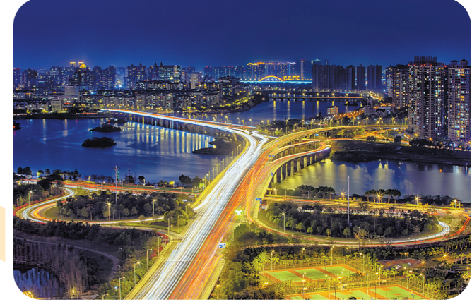
惠州城市夜景

作为深圳优质外溢产业的承载地,惠阳提出探索深惠产业共建新模式,推动惠阳产业园区与深圳创新资源的对接合作,重点建设惠阳(新圩)智能制造产业园、秋月湖生态智慧城等协同发展战略平台,打造深圳先进产业外溢首选地。