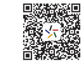
广东体彩网征召平台

至于奖金的使用,小坚表示:“奖金会先存银行,留着以后给孩子读大学用。当然也会继续支持体彩彩票。”(吴珊 粤体彩)