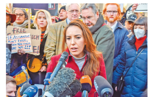
阿桑奇未婚妻日前接受媒体采访

莫里斯在接受专访时指出，阿桑奇的引渡案“很明显是一场出于政治动机的诉讼”，暴露出美国司法的“长臂管辖”。在她看来，阿桑奇作为一名生活在英国的澳大利亚人，与美国司法的唯一关联在于他曝光了美国的战争罪行、间谍行为和干预他国内政、窃听成癖的证据。美国要求引渡阿桑奇的真正动机是假借司法程序实施报复，这也是美国践踏他国主权的又一铁证。阿桑奇创办的“维基揭秘”网站2010年披露大量关于阿富汗战争和伊拉克战争的美国外交电报和美军机密文件，揭发美军战争罪行，如其中一段驻伊美军“阿帕奇”武装直升机射杀路透社记者和平民的视频广为流传。阿桑奇随即身陷官司，受到美国17项间谍罪名和1项不当使用电脑罪名指控。2019年，阿桑奇在英国被捕并被判入狱。随后，美国以“维基揭秘”公布涉美秘密文件危及他人生命安全为由，要求引渡阿桑奇。