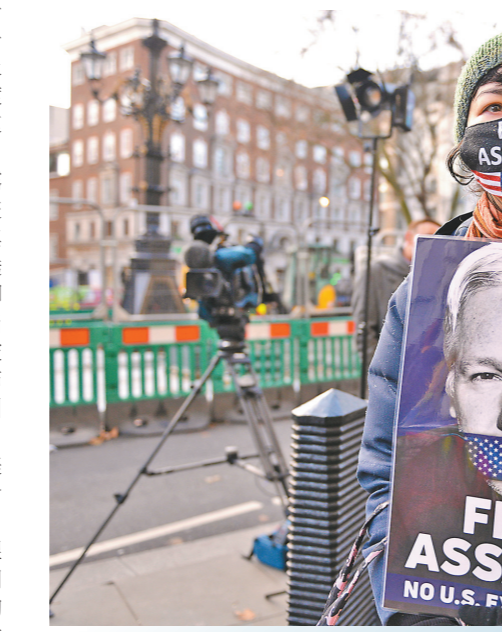
阿桑奇支持者日前在伦敦集会，要求释放阿桑奇

莫里斯在接受专访时指出，阿桑奇的引渡案“很明显是一场出于政治动机的诉讼”，暴露出美国司法的“长臂管辖”。在她看来，阿桑奇作为一名生活在英国的澳大利亚人，与美国司法的唯一关联在于他曝光了美国的战争罪行、间谍行为和干预他国内政、窃听成癖的证据。美国要求引渡阿桑奇的真正动机是假借司法程序实施报复，这也是美国践踏他国主权的又一铁证。阿桑奇创办的“维基揭秘”网站2010年披露大量关于阿富汗战争和伊拉克战争的美国外交电报和美军机密文件，揭发美军战争罪行，如其中一段驻伊美军“阿帕奇”武装直升机射杀路透社记者和平民的视频广为流传。阿桑奇随即身陷官司，受到美国17项间谍罪名和1项不当使用电脑罪名指控。2019年，阿桑奇在英国被捕并被判入狱。随后，美国以“维基揭秘”公布涉美秘密文件危及他人生命安全为由，要求引渡阿桑奇。