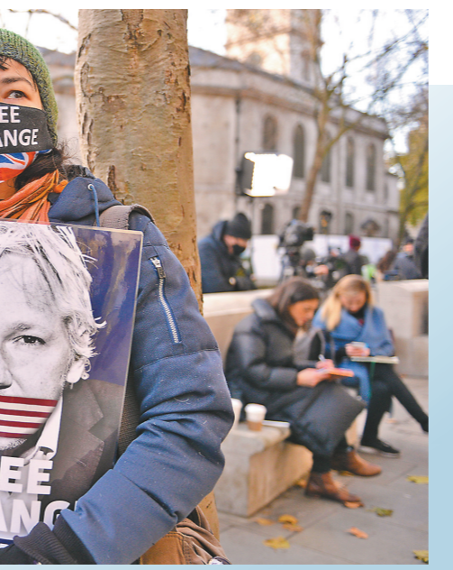
阿桑奇支持者日前在伦敦集会，要求释放阿桑奇 图/人民视觉

莫里斯说，她担心，一旦阿桑奇被引渡到美国，将被剥夺获得公平审判的权利，甚至有性命之忧。莫里斯最后表示，她对未来还是充满希望的，因为针对阿桑奇的“案子太离谱了，是很明显的权力滥用，美国在此案中的诸多方面都构成了犯罪”。她将坚决斗争到底，直至阿桑奇重获自由。