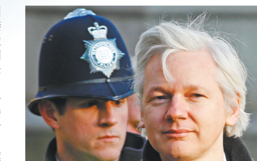
朱利安·阿桑奇(右)

据新华社电“维基揭秘”网站创始人朱利安·阿桑奇的未婚妻莫里斯日前接受新华社独家视频专访时说，因曝光美国在伊拉克和阿富汗战场上战争罪行等，阿桑奇面临美国的引渡诉讼，美国在阿桑奇案上的种种恶行显示其在人权问题上根本无权对他国指手画脚。英国高等法院10日批准了美国引渡阿桑奇的要求，这推翻了一名英国法官年初以阿桑奇精神状况不佳为由驳回美方引渡要求的裁决。对此，莫里斯表示，会向英国最高法院提起上诉。