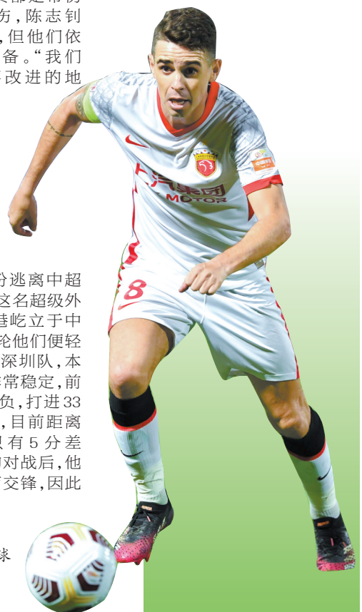
奥斯卡在比赛中控球