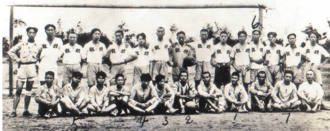
中华苏维埃共和国“五卅”体育运动大会足球冠军、亚军运动员合影