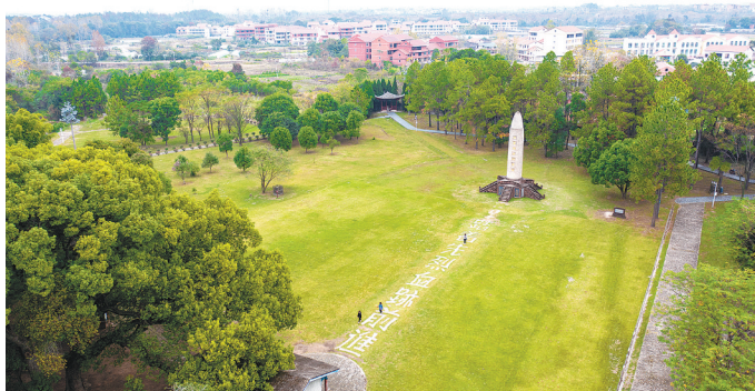
叶坪红军广场,“五卅”运动会的田赛、径赛在此进行

“五卅”运动会时间之长、项目之多、竞赛之激烈,都是前所未有的,被认为是全运会的前身,是新中国社会主义体育的基础和先声,在中国近代体育史上具有特殊的历史地位。此后苏区和根据地大大小小的运动会,无不深深烙下“五卅”运动会的印记。“五卅”运动会的胜利召开标志着红色体育正式拉开帷幕,点燃了战火硝烟中的革命浪漫主义,鼓舞着苏区人民自强不息、奋勇向前,战胜敌人的决心。