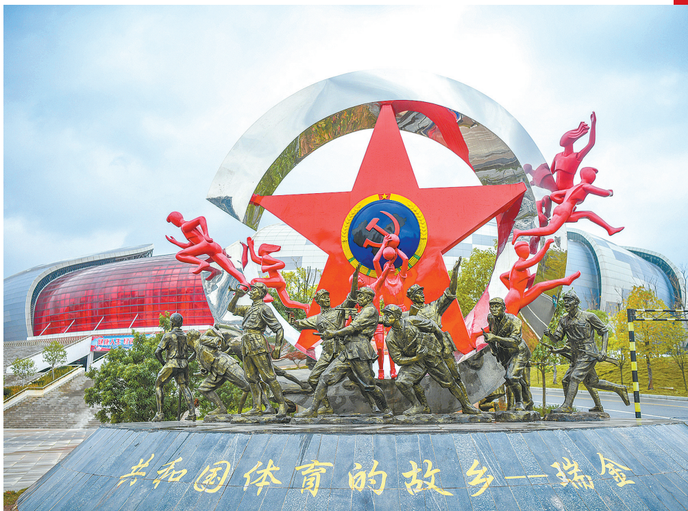
瑞金市体育中心场外雕塑上写着“共和国体育的故乡——瑞金”

江西瑞金,被称为共和国的摇篮。人民共和国从这里走来,而我们的追寻红色体育之旅也从瑞金启程。在瑞金市体育中心场外的雕塑上,“共和国体育的故乡——瑞金”几个大字格外醒目,这座雕塑诉说着这座红色城市与体育的渊源。场内一群男孩正在进行足球比赛,加油声、呐喊声此起彼伏,一幕幕场景仿佛一把历史铜匙将我们的红色记忆打开,将我们带回到88年前的“五卅”体育运动会。