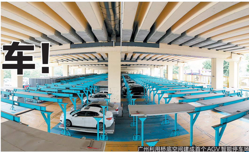
广州利用桥底空间建成首个AGV智能停车场