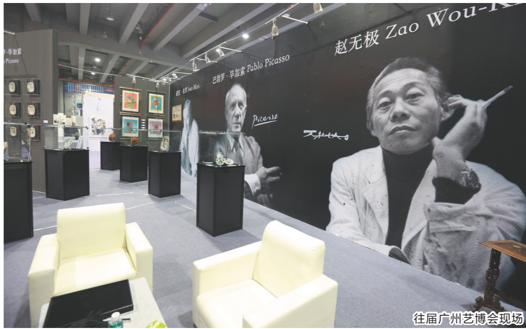
往届广州艺博会现场

2021年12月17日/星期五/文化副刊部主编 责编 李力/美编 伍若龙/校对 李红雨