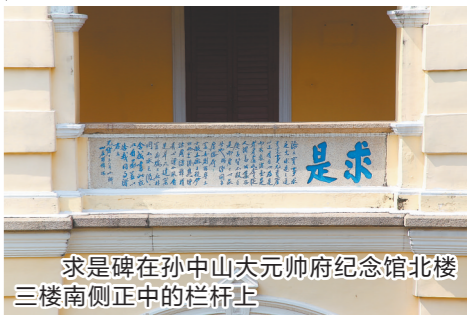
求是碑在孙中山大元帅府纪念馆北楼三楼南侧正中的栏杆上

1917年至1925年间，孙中山三次在广东建立革命政权，两度征用广东士敏土厂办公楼作为大元帅府。广东士敏土厂虽照常运转，因经营不善，几经周折，于1933年并入新成立的西村士敏土厂。时光荏苒，忽忽百年，这块广东士敏土厂的“求是碑”见证了广州大元帅府旧址的前世今生，可谓弥足珍贵，其文意亦足以垂训今人。