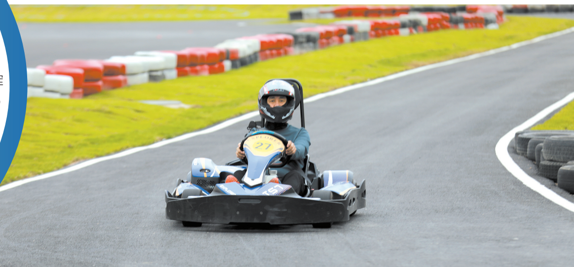
国际投资公司赛车场