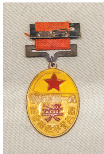
延安八一运动会奖章，陕西体育博物馆藏