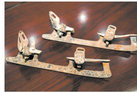
贺龙在山西兴县李家湾居住时使用的滑冰刀，晋绥边区革命纪念馆藏