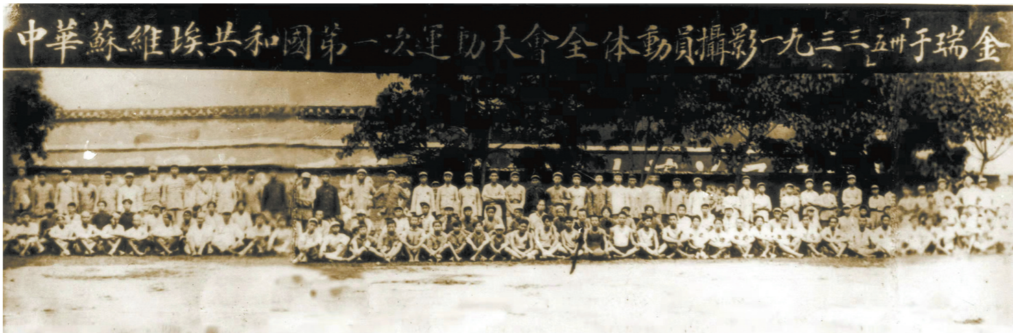
1933年中华苏维埃共和国“五卅”体育运动大会全体运动员合影