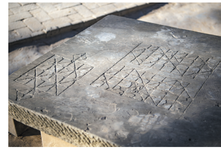
延安枣园朱德旧居石桌上的图案，右边大棋盘是传统的象棋，左边的小棋盘是地方棋，当地称之为“憋死牛”“老虎吃绵羊”或“狼吃娃”