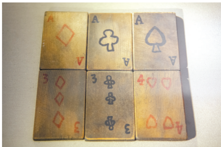
抗大学员自制的木质扑克牌，中国人民抗日军政大学纪念馆藏