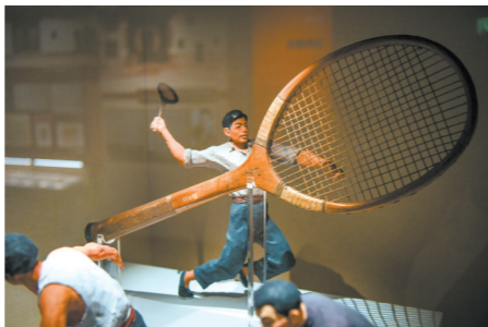
红军指战员使用过的网球拍，瑞金中央革命根据地历史博物馆藏