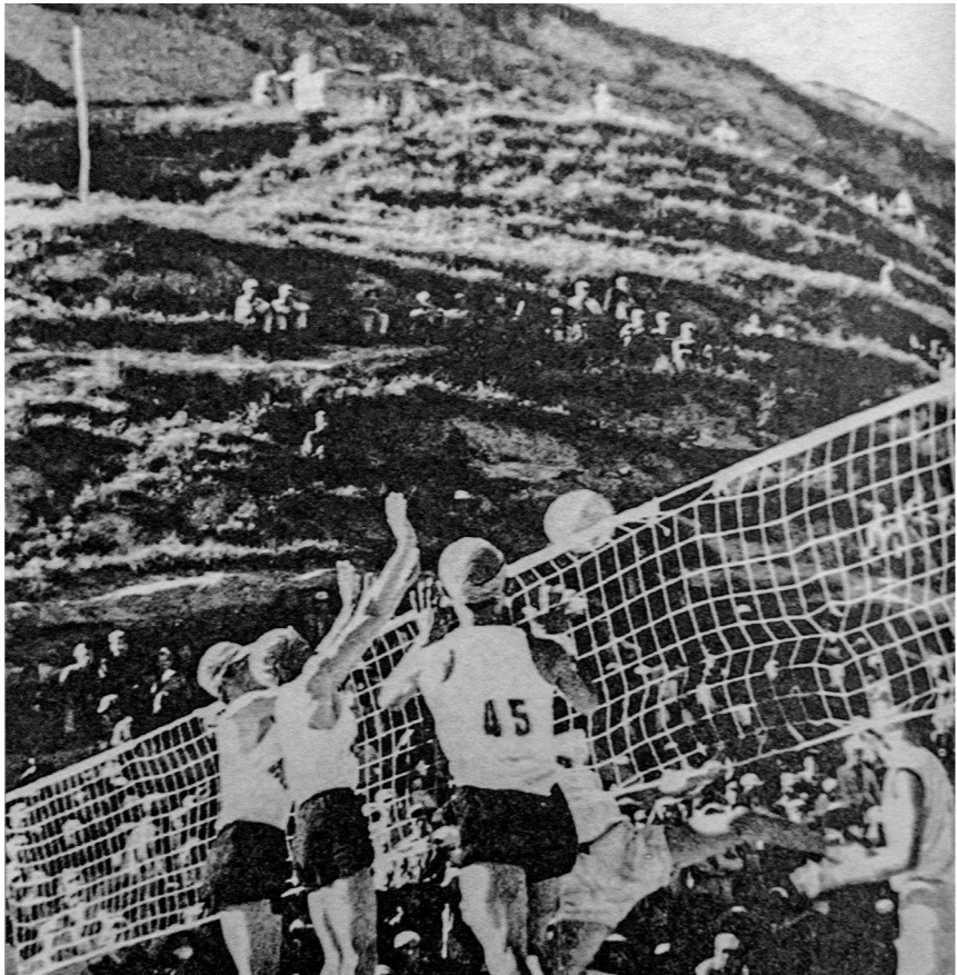
1942年延安“九一”扩大运动会中的排球比赛