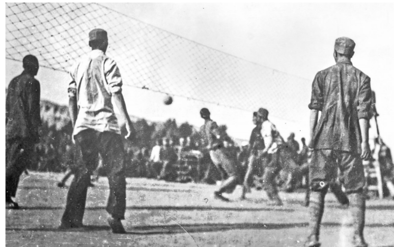
抗大七分校一周年时的排球比赛