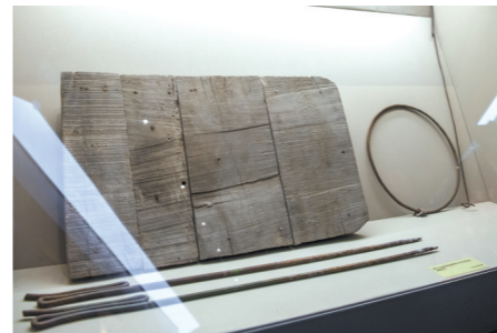
陕甘宁边区延安城里孩子们用的铁环和滑冰车，陕西体育博物馆藏