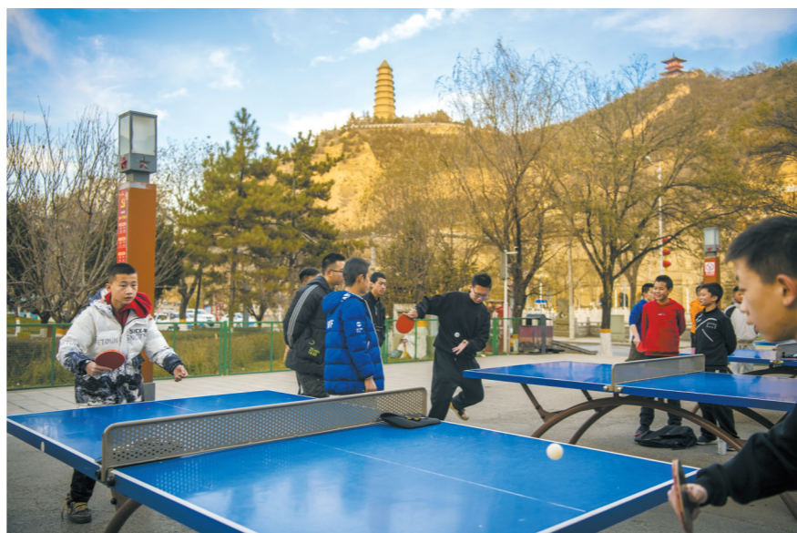
原延安南关体育场，1937年卢沟桥事变爆发后，在此举行了“八一”抗战动员运动大会。现在这里已修建了体育馆和体育场，是延安市民运动健身的重要场所