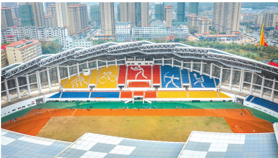
江西瑞金是共和国体育的故乡，图为瑞金市体育中心体育场，场内市民们正在跑步健身