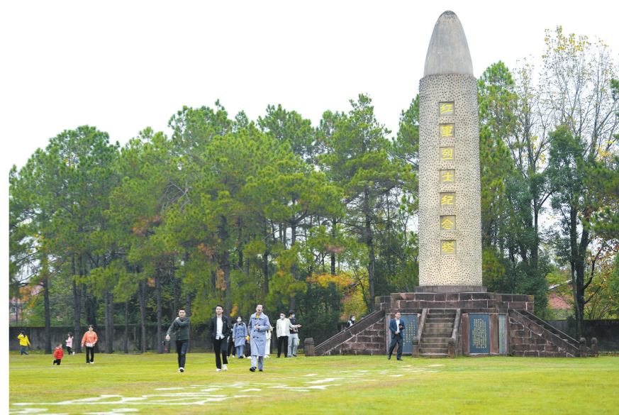
瑞金叶坪红军广场，1933年中华苏维埃共和国“五卅”运动会的田赛、径赛在此进行

红色体育是发生在1921年至1949年间，中国共产党领导下的广大解放区范围内的体育事业的总称。强筋骨、健体魄、树信心、聚人心，在民族独立、救亡图存的革命年代贡献巨大。它既是世界体育史上独一无二的奇观，也是中国革命史上的一道壮丽景观。