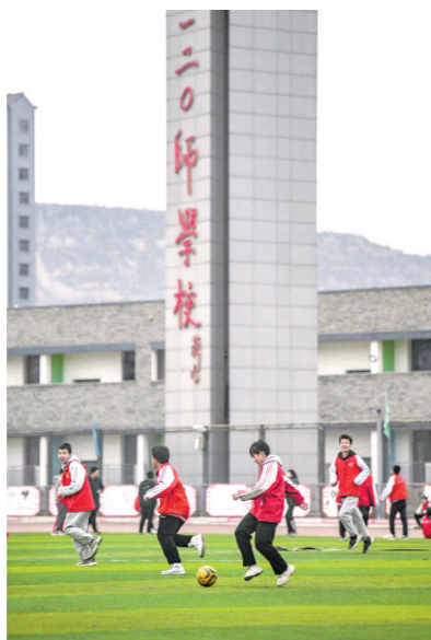
一二〇师学校是国内首座由抗战时期八路军师部番号命名的学校