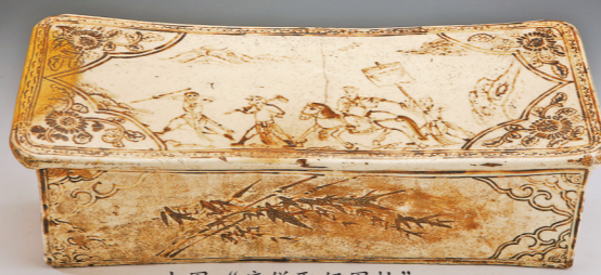
上图:“唐僧取经图枕” 下图:“宋金项饰”

其中,广东省博物馆(以下简称“粤博”)馆长肖海明带着从华南重要考古遗址——广东省韶关市曲江石峡遗址(以下简称“石峡遗址”)中采集土壤和馆藏珍贵文物“唐僧取经图枕”参与此次特展启动仪式。