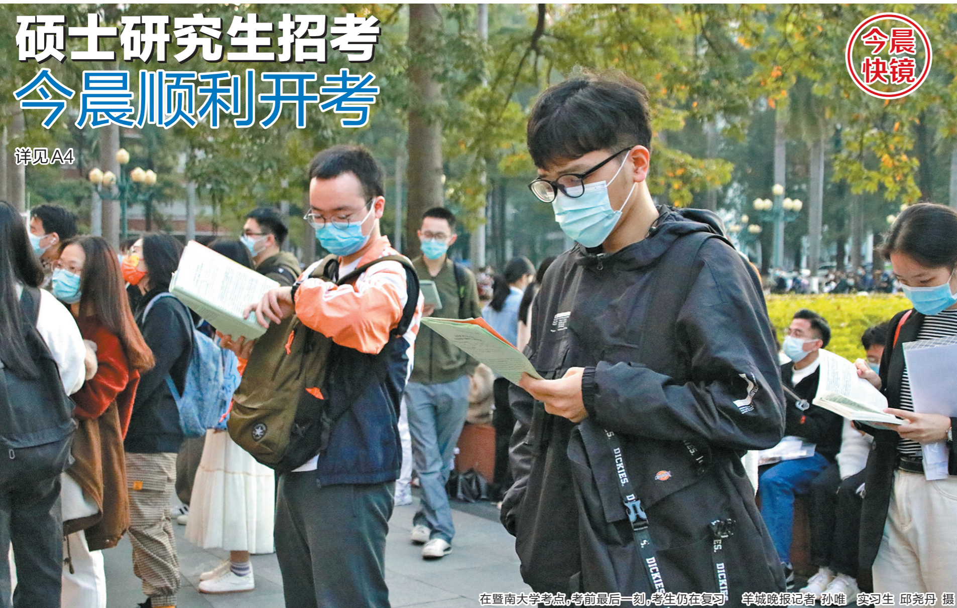
在暨南大学考点,考前最后一刻,考生仍在复习。