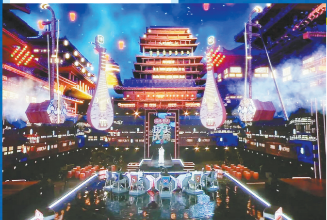
“国乐之城”给予观众沉浸式视听体验

刚刚推出了新歌《不想当阿龙》的她,透露歌名《不想当阿龙》其实就是“I don't wanna be alone”的谐音:“在疫情期间,人和人之间的亲密关系显得更加可贵、难得。这首歌也是想和大家分享,怎么在孤独的时候能够活出精彩吧。”