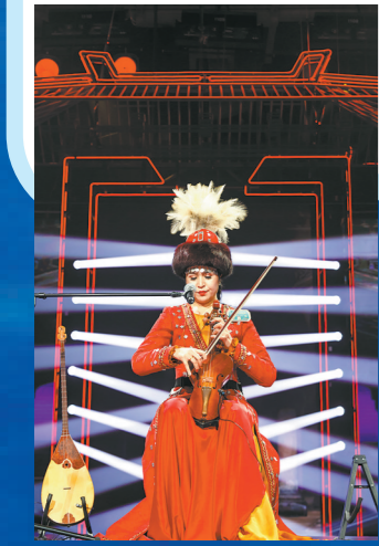
青春乐手演奏库布孜