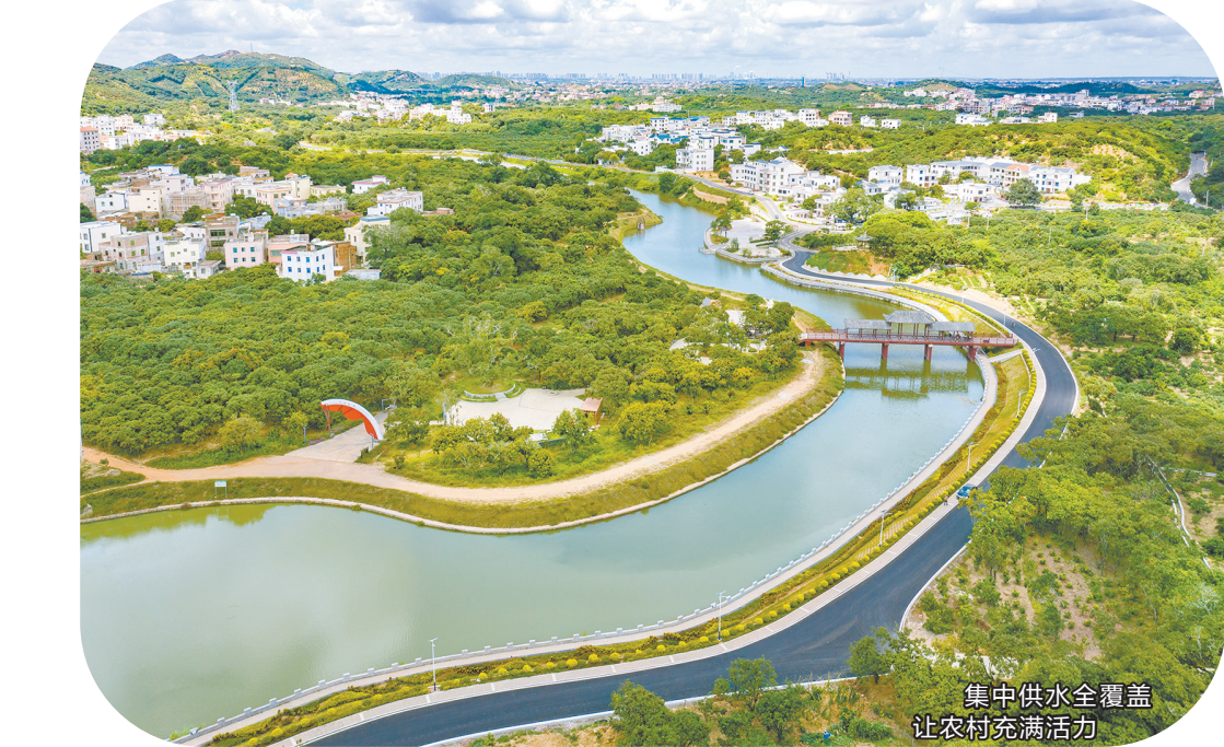
集中供水全覆盖 让农村充满活力

时光回溯，今年5月，茂名聚焦基层治理、突出问题导向，成立了由市委书记任第一组长、市长任组长的工作专班，出台相关方案，水务、发改、财政等部门各负其责、协同发力，让“放心水”流入千家万户。茂名市委书记、市人大常委会主任袁古洁在全市农村集中供水工作