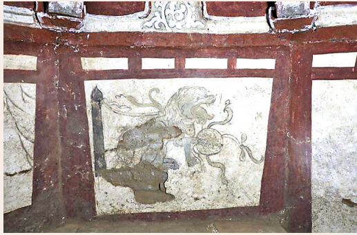
狮戏绣球图