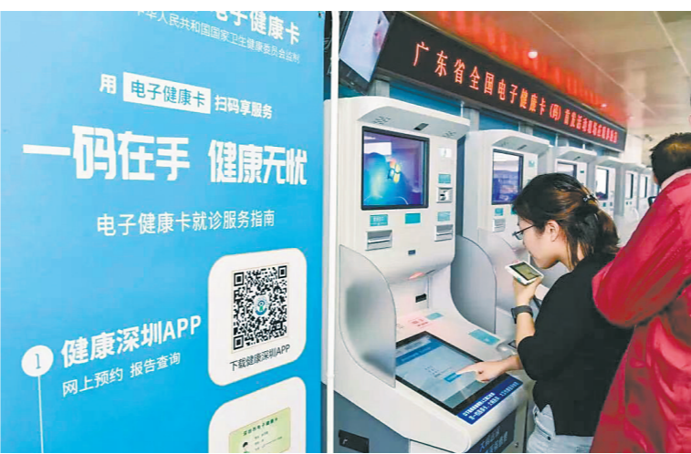
智慧就医手段方便广东群众（资料图片）

2021年，越来越多新药、好药、高值耗材通过集采后价格大幅下降，并纳入医保范围。广东省超额完成国家药品和耗材集采任务，共落实了五批共218个国家集中采购药品以及两批国家组织高值医用耗材采购任务。 以2021年5月1日落地的第四批集采药品为例，其涉及高血压、糖尿病、消化道疾病、精神类疾病、恶性肿瘤等多种治疗领域。如治疗呼吸道支气管炎的药物氨