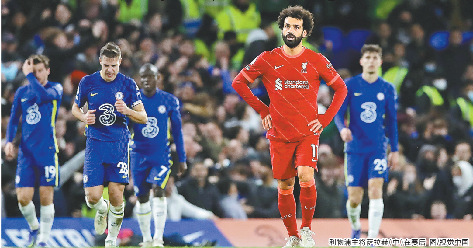
利物浦门将萨拉赫(中)在赛后

羊城晚报今晨消息 记者徐扬报道:英超第21轮的一场焦点大战今晨在斯坦福桥球场打响,主队切尔西在失先两球的逆境中连扳两球,最终以2比2逼平利物浦。至此,切尔西以43分列积分榜次席,利物浦以1分之差排名第三。