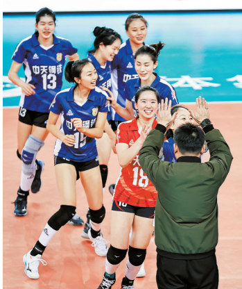
江苏队队员与主教练蔡斌庆祝胜利