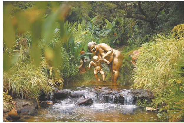
母与子(雕塑) □许鸿飞

2022年元旦起至农历正月十五,许鸿飞雕塑艺术百村展第16站在广州黄埔长岭开幕。