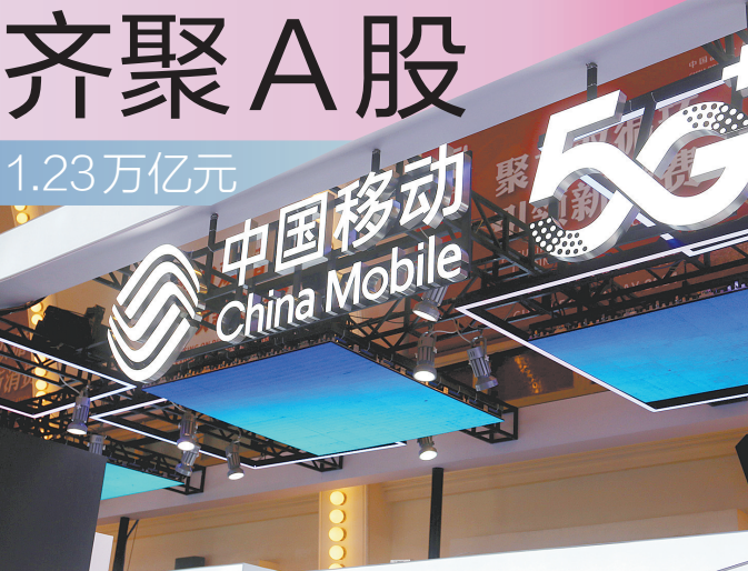
中国移动股价首日微涨

羊城晚报记者 林曦 投资者们都为中国移动的上市捏了一把汗。虽然不久前遭遇弃购金额超过7亿元,刷新了A股最高弃购纪录,但是中国移动A股上市第一天的表现,还是可圈可点。 1月5日,近10年来A股最大IPO、“巨无霸”中国移动在上海证券交易所主板上市交易,中国移动本次发行价为57.58元,开盘涨9.41%,报63元,总市值超1.3万亿元。截至当天收盘,股价回落,报57.88元,收涨0.52%,总市值为1.23万亿元。至此,中国移动、中国电信、中国联通三大国内运营商齐聚A股了。