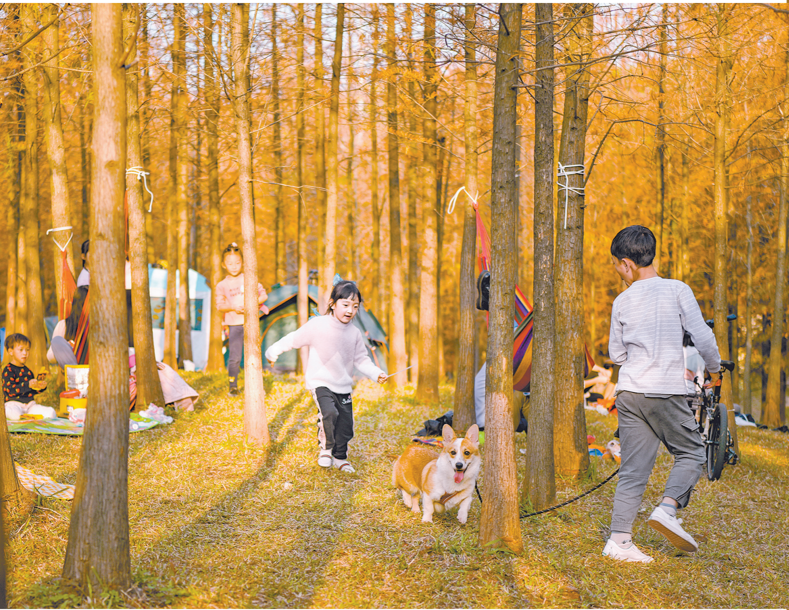
市民在公园玩耍

羊城晚报讯 记者徐振天报道：在公园草坪搭个帐篷，三两好友或坐或卧享用野餐，是多么惬意的一番景象……这种新玩法，广州市民也可以享受了。记者9日获悉，从今年元旦起，广州推出第一批24个公园