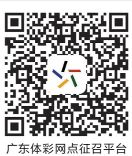
广东体彩网征召平台

值得一提的是，在排列5第21303期开奖中，该体彩实体店一购彩者凭一张6元投入的单式票中得排列5头奖10万元，体彩旺店实至名归。