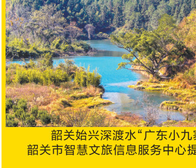
韶关始兴深渡水“广东小九寨”