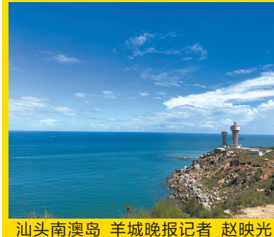
汕头南澳岛