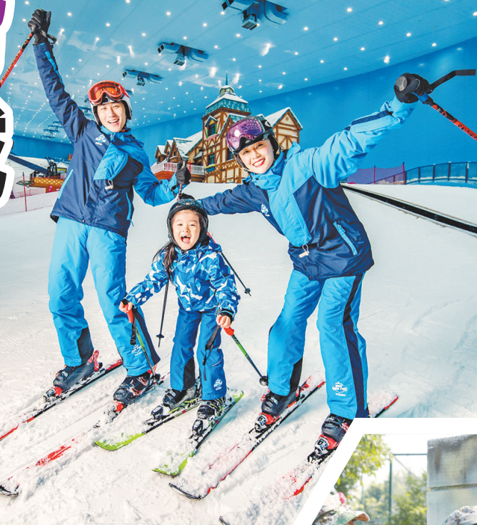
滑雪是体育运动的头号大热门