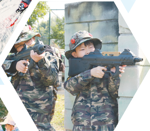
青少年酷爱射击运动