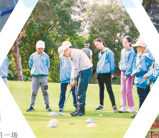
为高尔夫赴一座城近年也吸引了大批年轻人

年国庆期间,冲浪、潜水等活动的预订量环比涨幅超200%,徒步、攀岩环比涨幅超13倍。