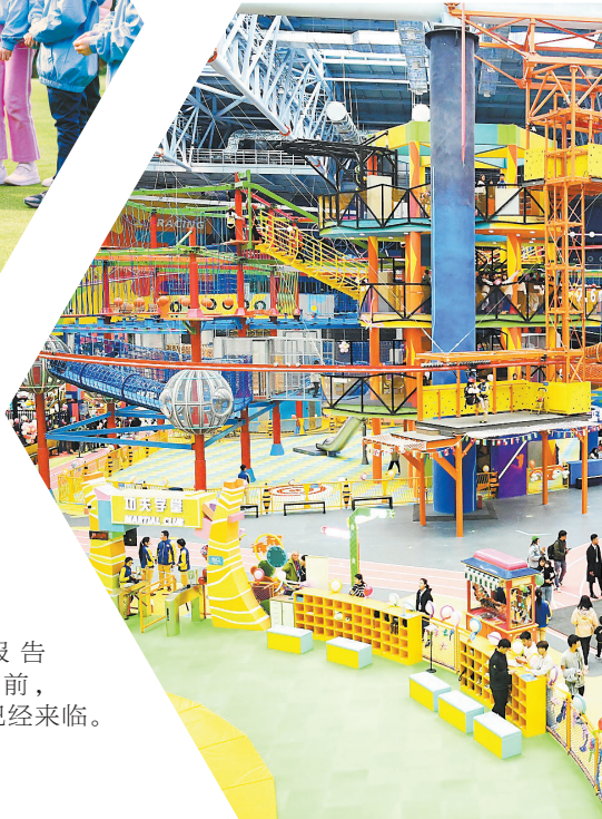
广州融创体育世界

正如《中国体育旅游消费大数据报告(2021)》中所指出:当前,体育旅游大众化时代已经来临。