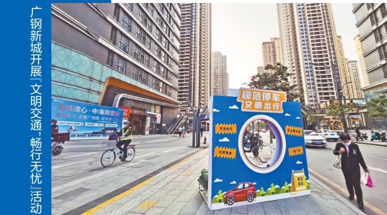
广钢新城开展文明交通,畅行无忧活动

日前,“文明交通,畅行无忧”志愿服务在市荔湾区广钢新城开展。长期以来,广钢新城因机动车违停导致道路拥堵而饱受居民诟病,一周前荔湾区成立联合执法队,开展常态化违停执法专项行动,同时结合多方力量参与的志愿服务行动,如今广钢新城居民表示道路拥堵现象有较大改善,希望成效能继续保持。