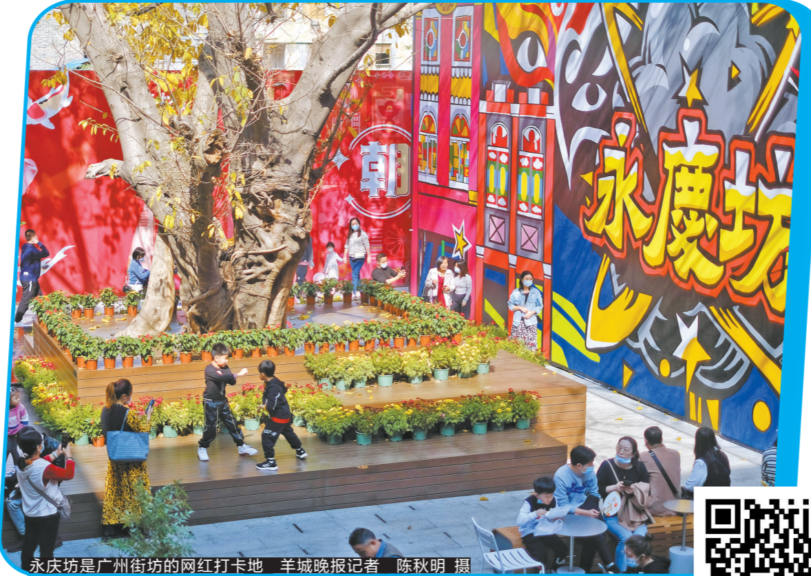
永庆坊是广州街坊的网红打卡地

为0.88,接近中度拥堵到严重拥堵的状态。“隧道开通后,大约能分担1/2的车流。”张宝湖说道。统计数据显示,在广州大道-官洲水道的范围内,现状日均通行量208.5万人次/日,其中道路出行132万人次/日,华南大桥-琶洲大桥现状道路出行49.7万人次/日。根据过江桥梁的交通量,南北向过江道路流量整体呈现西高东低态势,现有桥梁整体运行处于饱和状态。相较于建桥,隧道的连接短、征拆难度小,对城市景观也影响较小。由于过江通道日益增长的交通需求,广州规划建设多条过江隧道。目前,鱼珠隧道、会展西过江隧道,以及东起海珠工业大道、西至荔湾芳村大道的东沙隧道,都已进场建设。