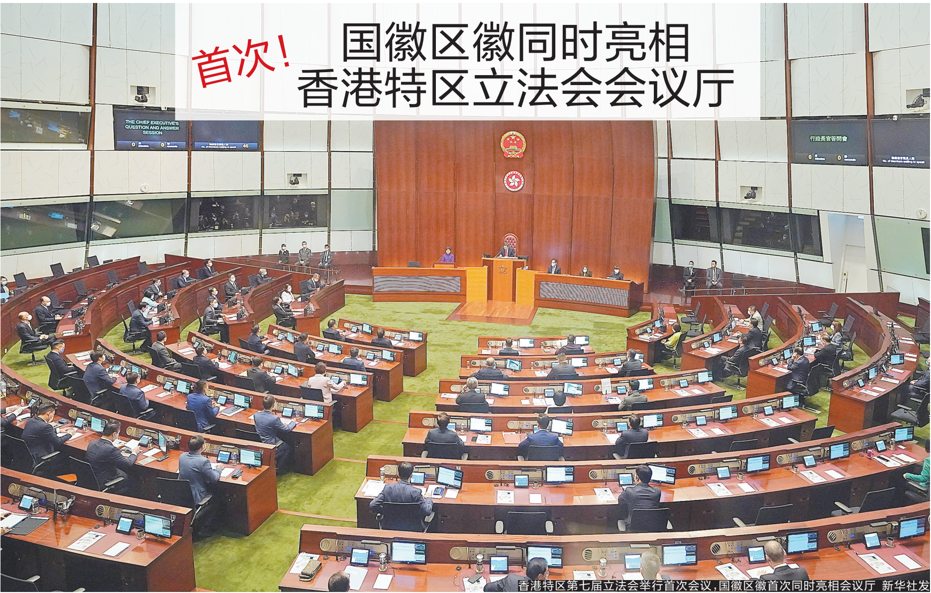
香港特区第七届立法会举行首次会议，国徽区徽首次同时亮相会议厅