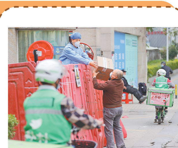
市民隔着护栏,向封控管控区内传递生活物资