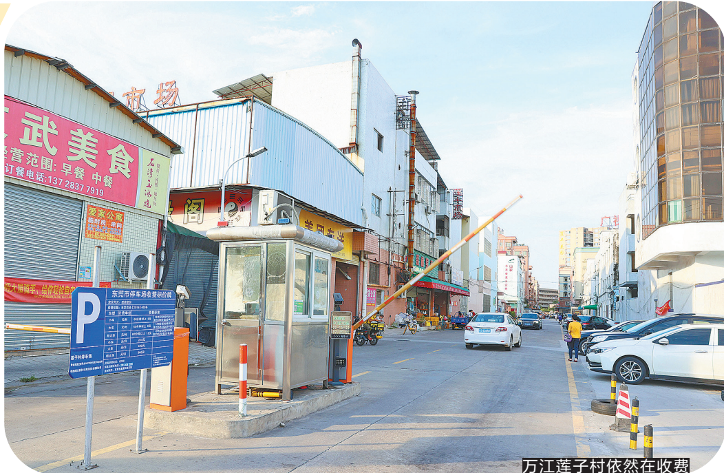
万江莲子村依然在收费

东莞市交通运输局回应称，在当前实际情况下，围合管理是发挥基层治理的必要补充和重要方式。