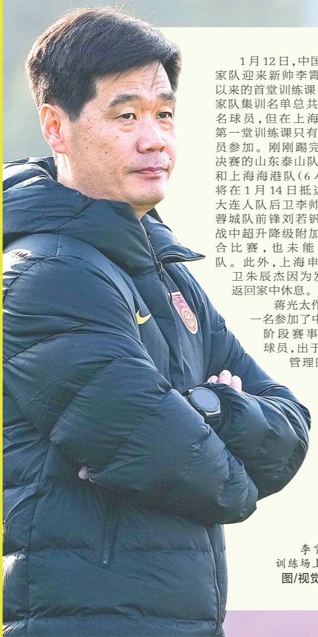
李霄鹏在训练场上

1月12日，中国男足国家队迎来新帅李霄鹏上任以来的首堂训练课。本次国家队集训名单共招入52名球员，但在上海集训的第一堂训练课只有27名球员参加。刚刚踢完足协杯决赛的山东泰山队(10人)和上海海港队(6人)球员将在1月14日抵达上海。大连人队后卫李帅和成都蓉城队前锋刘若钊由于出战中超升降级附加赛次回合比赛，也未能按时归队。此外，上海申花队后卫朱辰杰因为发烧，已返回家中休息。