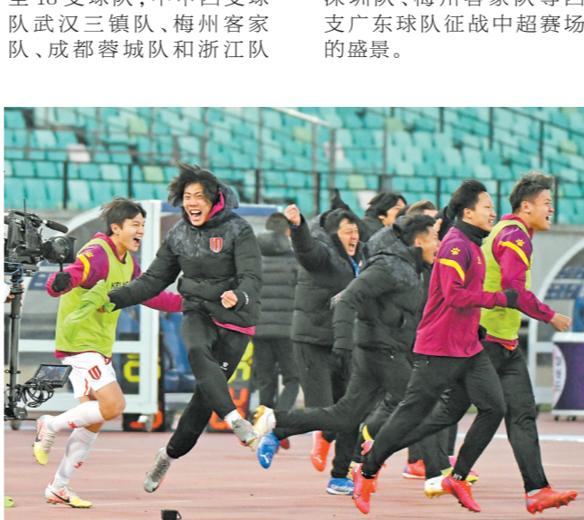
成都蓉城队替补球员庆祝球队升入中超

将征战中超。中超赛场也将出现广州队、广州城队、深圳队、梅州客家队等四支广东球队征战中超赛场的盛况。