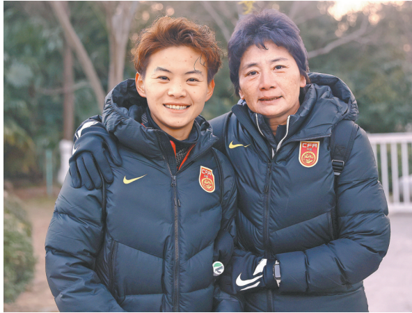
水庆霞 (右)与王霜