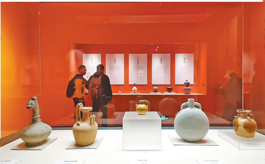
展览现场

物和自然标本，包括：青铜爵、松鼠葡萄纹犀角杯、银龙纹花鸟人物故事图三龙足冰酒桶、象牙雕酒筹、银纹章留白三国演义人物故事图高脚杯、清陈云龙夜宴图轴、锡刻花小执壶、酿酒工具、酒埋等，令观众眼界大开。此外，一箱1974年产的贵州茅台酒也在现场展出。2021年6月在伦敦苏富比拍卖会上，这箱贵州茅台酒以100万英镑成交(折合人民币约900万元)，创下了中国境外单批整箱茅台酒有史以来最高的价格。 本次展览是粤博继举办玉文化、中国茶文化、香文化系列展览之后，推出的又一文化展，将持续展至4月10日。