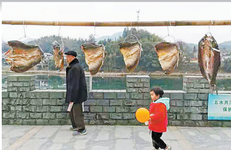
近日，在浙江开化县华埠镇江滨路上看到，路边有市民晾晒的鱼干，感觉年味渐浓。华埠地处浙皖赣三省七县交界，是浙西古镇和商埠重镇，素有浙西“小上海”之称。每年春节前夕，镇上的居民们有制作鱼干的传统习俗。