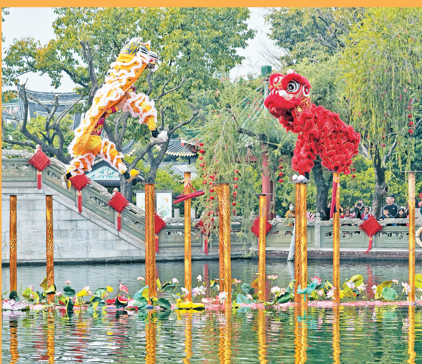
昨日，醒狮在水上梅花桩阵上做出腾、挪、闪、扑、回旋、飞跃等高难度动作

据介绍，2月1日—6日（大年初一至初六），宝墨园荔景湖水上舞台每天将分别上演两场醒狮表演（11:00—12:00，14:30—15:30）。