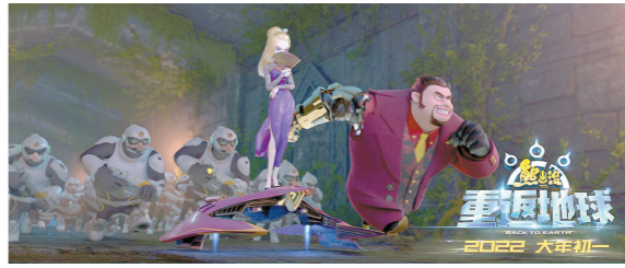
新反派牛老板和牛夫人

羊城晚报：今年春节档除了《熊出没·重返地球》，还有《喜羊羊与灰太狼之筐出未来》《小虎墩大英雄》两部动画片，你对自己的作品是否有信心？