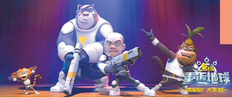
熊大、光头强、吉吉国王与毛毛

今年进军贺岁档的《熊出没·重返地球》是该系列的第8部作品，这回，故事扩展到了外太空。该片导演林汇达在接受羊城晚报记者独家专访时表示，影片虽然拓展到了宇宙，但情感仍来自身边的家人。应对春节档“熊”“羊”“虎”之争，他大方表示：“只有大家共同努力，一起越做越好，才是对我们整个行业真正的利好。”