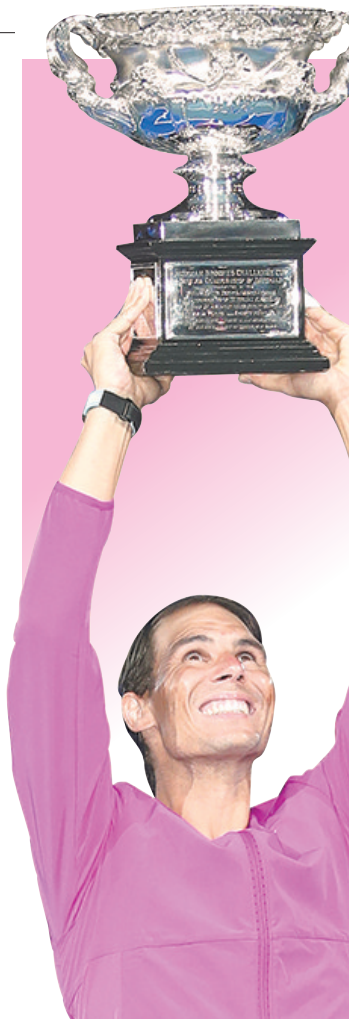
纳达尔捧杯庆祝

广州市、区两级体育行政部门高度重视场馆开放期间的安全管理和疫情防控工作,组织专业力量,采取有效措施,检查排查一切存在的安全隐患;按照“谁开办、谁负责”的原则,认真落实预约、错峰、限流等疫情防控措施,加强场馆消杀检查,为在穗过年群众提供一流的体育健身服务。