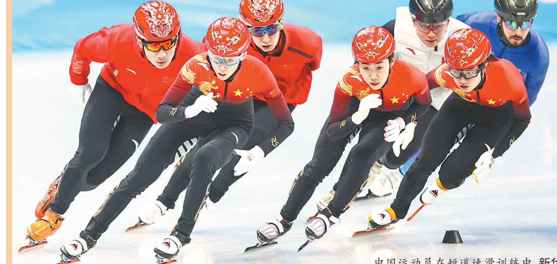
中国运动员在短道速滑训练中

据新华社北京电 参加北京冬奥会的中国短道速滑队昨日来到首都体育馆进行了赛前训练,队员们悉数到场,状态良好。