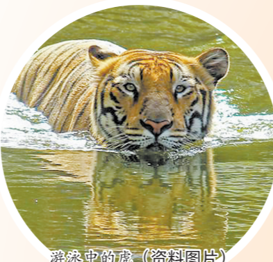
游泳中的虎(资料图片)

总之，在东方，人们通常都认为老虎才是“百兽之王”——这并不是因为它脑门上的花纹决定的，而是在竞争中得来的结论。但在西方，独居的老虎的身影相对较为少见，狮子的威武则被更多人见到并认同，所以才被尊崇为“百兽之王”。