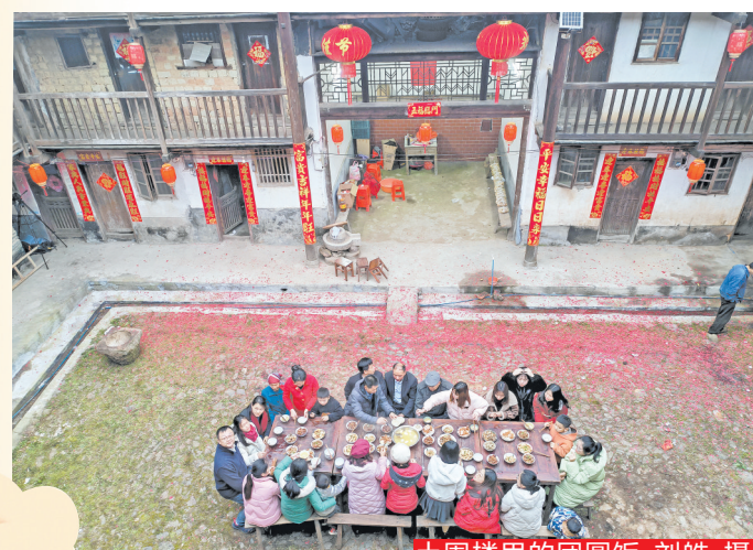
土围楼里的团圆饭