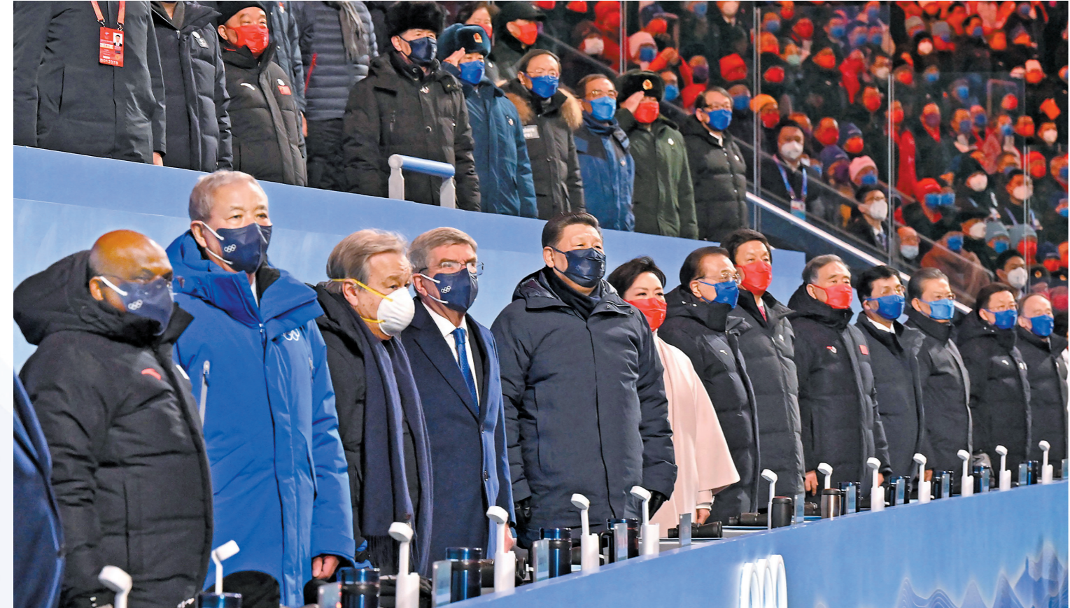
习近平、李克强、栗战书、汪洋、王沪宁、赵乐际、韩正、王岐山等党和国家领导人出席开幕式

李克强栗战书汪洋王沪宁赵乐际韩正王岐山 国际奥委会主席巴赫 来自世界各地的领导人和贵宾等出席