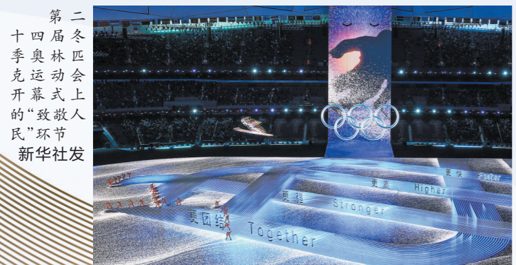
第二十四届冬季奥林匹克运动会开幕式上的“致敬人民”环节

【致敬世界人民】在致敬人民的环节,来自世界各地的76名年轻人,同向同行,并肩向前,他们走过之处,形成一条由照片组成的影像长河,展现全世界休戚与共、共克疫情的画卷以及运动员为梦想拼搏的激情瞬间。“这是向全世界人民致敬,舞台两边的中国结象征着团结,而他们走过舞台后,又幻化为‘一起向未来’的冬奥口号。”张艺谋说。