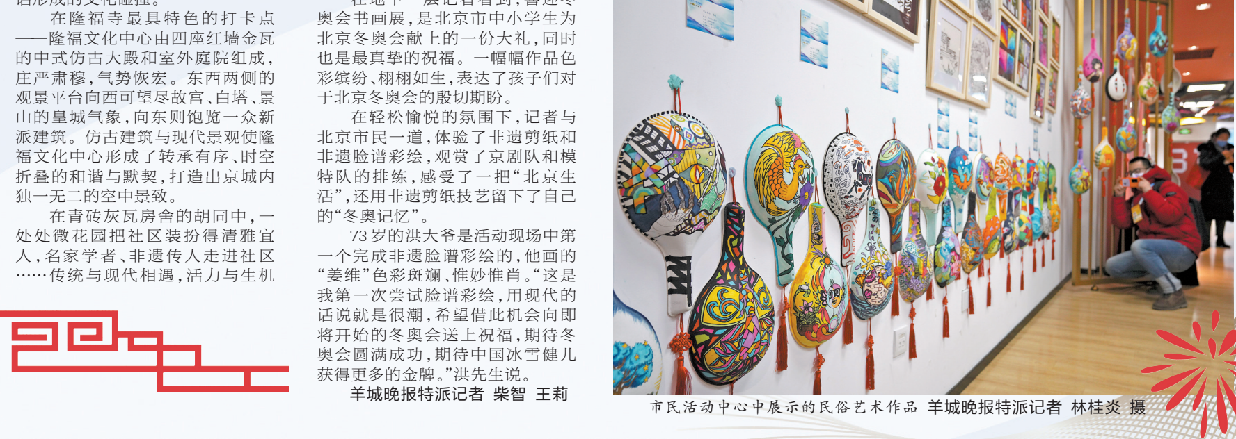
市民活动中心展示的民俗艺术作品