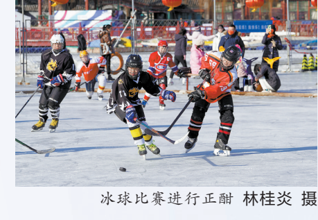
冰球比赛进行正酣 林桂炎 摄