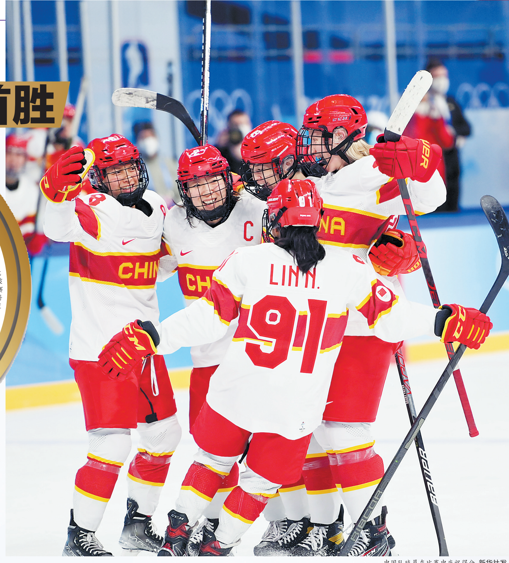
中国队球员在比赛中庆祝得分