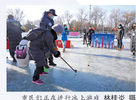
市民们正在进行冰上游戏

回当年的记忆，毕竟那是我们最美好的青春。我也想借着这个机会，祝福北京冬奥会，北京加油！中国加油！”白瑞璋说。 在65岁的老北京人李光看来，滑冰就是个乐。“其实即使没有北京冬奥会，滑冰也是北京老百姓在冬天最好的娱乐方式，现在冬奥会则让北京的冰雪运动全面提升。” 李光告诉羊城晚报记者，在1月份