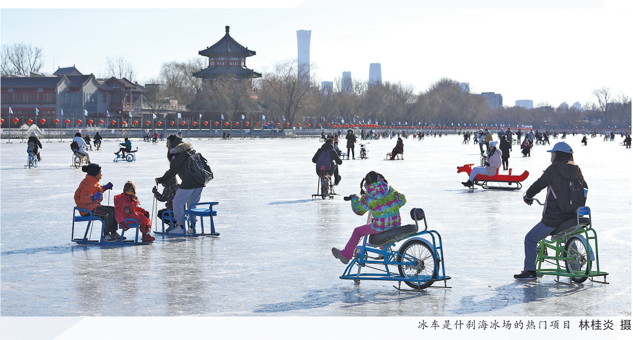
冰车是什刹海冰场的热门项目

对于即将开放的北京冬奥会，李光表示将重点关注速滑比赛，“不光是看精彩的比赛，还要跟运动员们学习速滑技术，我还想滑得更快一些，这可是一门大学问啊。” 羊城晚报特派记者 柴智 王莉