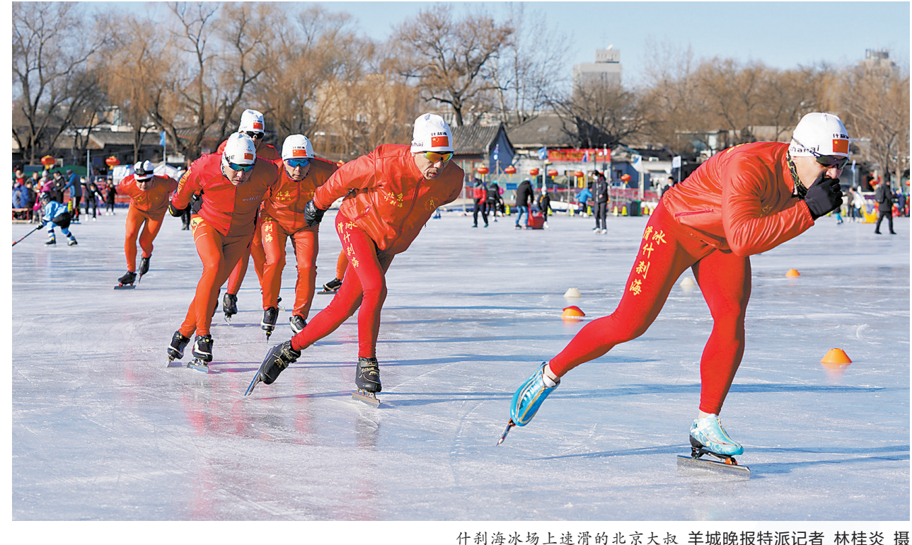
什刹海冰场上遼滑的北京大叔

对于即将开放的北京冬奥会，李光表示将重点关注速滑比赛，“不光是看精彩的比赛，还要跟运动员们学习速滑技术，我还想滑得更快一些，这可是一门大学问啊。” 羊城晚报特派记者 柴智 王莉