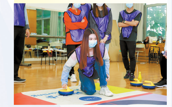
暨南大学旱地冰壶活动

羊城晚报讯 记者李煊坤摄影报道:2月4日,第二十四届冬季奥林匹克运动会开幕式在国家体育场举行。在南方广州,《2022冬季奥运会吉祥物诞生记》主题展览正在广州塔展出。据悉,本次展览由广州市海珠区委宣传部、广州美术学院视觉艺术设计学院、广州塔联合主办,以时间轴的形式展现了“冰墩墩”诞生过程的重要时刻和值得记录的片段。