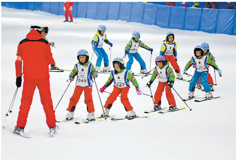
如今滑雪已成潮流，是大小朋友们都愿意积极参与的一种运动