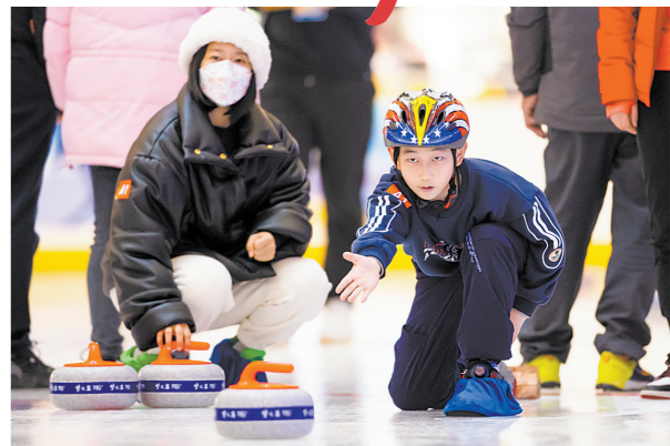
南京河西一家冰雪馆里，一名男孩正在专注地体验冰壶运动