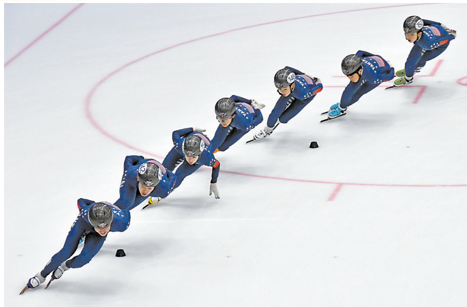
山东烟台冰上运动中心的小队员们在进行短道速滑训练

随着北京冬奥会赛事的高潮迭起，全国各地共同参与冰雪运动的热情也十分高涨。各大滑雪场、溜冰场上，男女老幼齐上阵，积极响应着北京冬奥会、冬残奥会主题口号——“一起向未来”。