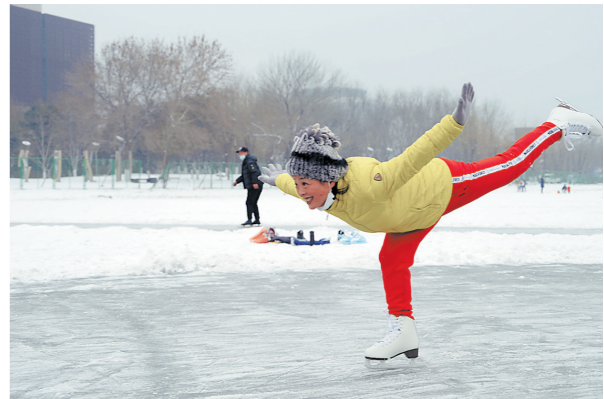
北京市民冰雪运动情绪高涨，在公园滑冰也忍不住晒晒好身手