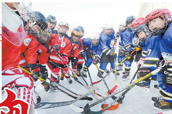
校园举办“冰雪嘉年华”主题活动，全副武装的孩子们在进行冰球比赛前的热身