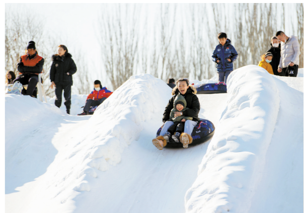
在东北，寒假怎能不玩雪。沈阳北陵公园冰雪大世界，母亲带着孩子正快乐享受冰雪运动