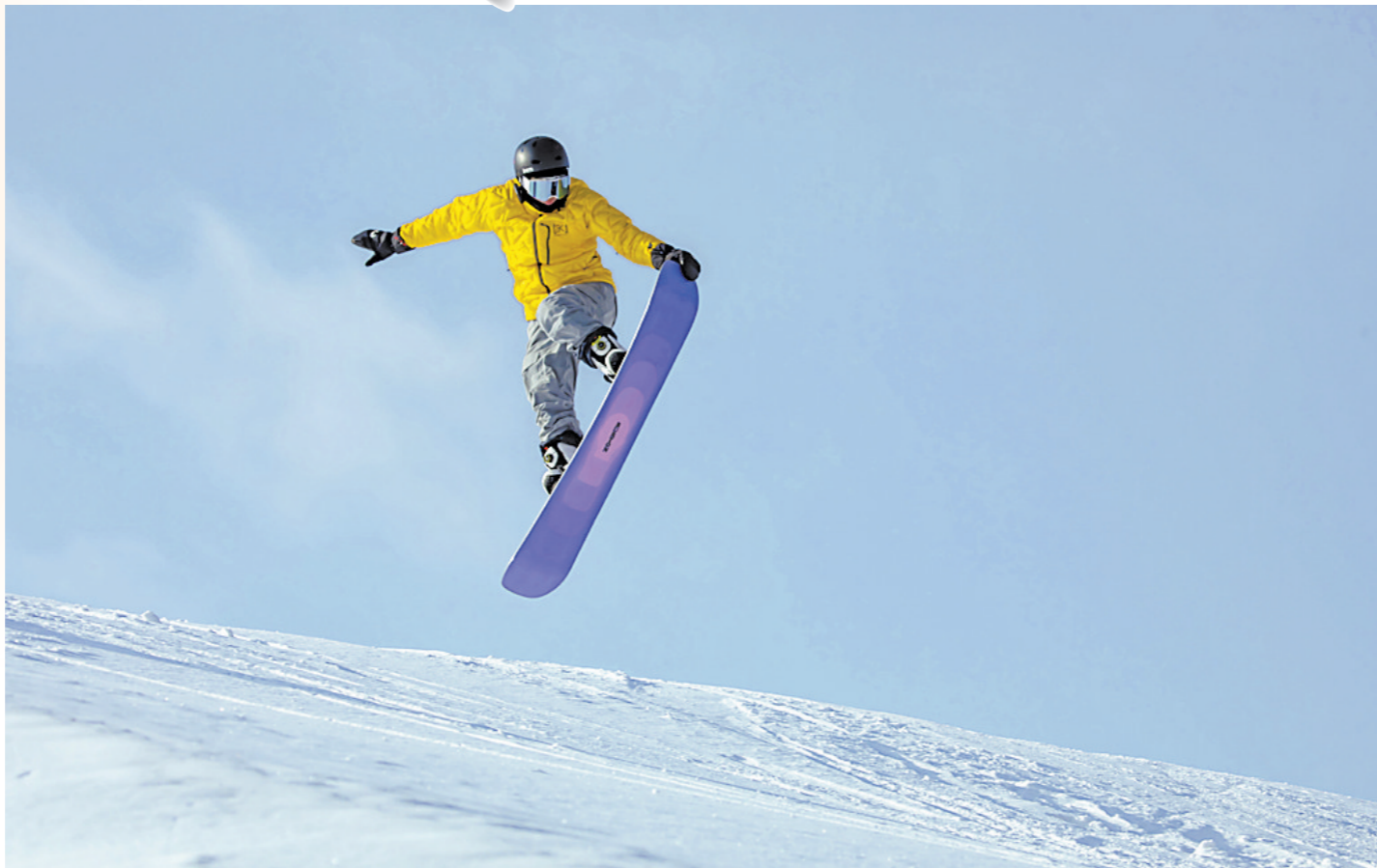
吉林松花湖度假区区内滑雪场公园的滑雪爱好者正在放飞自我

2022年北京冬奥会已拉开大幕。打开电视机，能看到各种激动人心的运动场面，赛场上处处是皑皑冰雪——冬奥会正是以冰雪运动为主的世界体育赛事，以滑雪、滑冰、冰球、冰壶、雪橇等比赛项目为主。