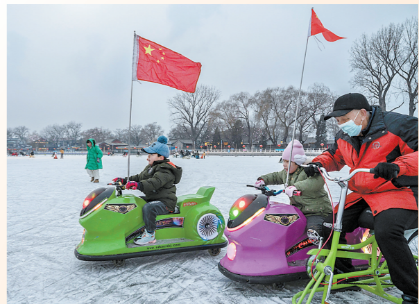
北京公园的湖面已结了厚厚的冰，在冰上玩冰车的孩子不忘升起国旗，为中国举办冬奥会助威