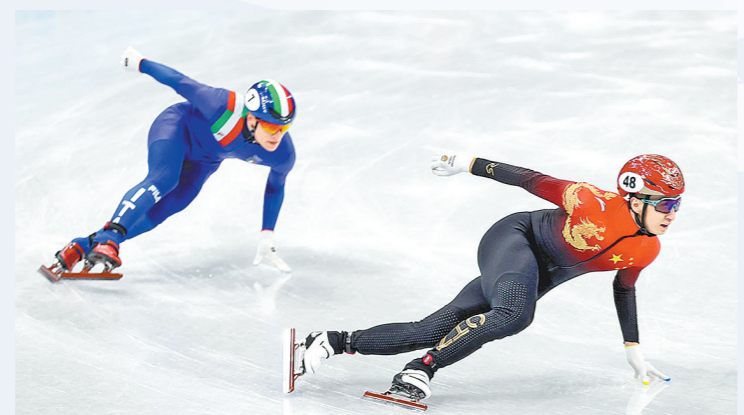
武大靖(右)发力冲刺

中国短道速滑队是王者之师，此前中国体育代表团获得的13枚冬奥会金牌中，他们便贡献了10枚。本届冬奥会，他们依然不负众望，打响头炮。昨日，参加2022年北京冬奥会短道速滑混合团体接力赛的五名名将将是精兵中的强将，合理的排兵布阵也是夺金的制胜法宝。