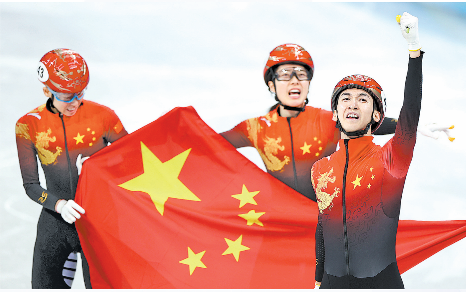
中国队夺得短道速滑项目混合团体接力冠军 新华社发