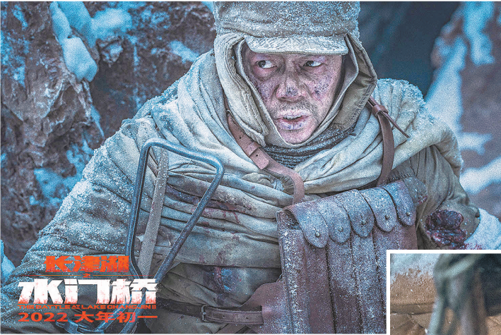
段奕宏饰演谈子为

影片也没有回避双方实力的悬殊，先头部队九连拼尽全力，仅把桥炸出一个小洞；主力部队七连的战斗更是悲壮，面对装备精良又占据地理优势的美军，七连战士做出了巨大的牺牲。影片本身在故事和情感上都能自圆其说：虽然志愿军最终仍没能把桥完全炸毁，但他们不仅让装备精良的美军损失惨重，更展现出中国人民保家卫国的决心和毅力，最终让美军仓皇撤出朝鲜；志愿军战士不惜用生命与热血守护家国的举动，成为这部影片的情感触点，打动了不少观众。