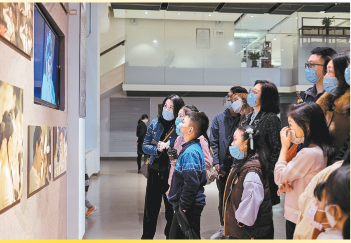
粤剧艺术博物馆吸引众多市民参观学习,越来越多青少年对粤剧产生兴趣

广东还增设戏剧演出场所,优化健全戏剧文化设施,助力戏剧的传承与传播。广东粤剧艺术中心、广州粤剧艺术博物馆、广东粤剧博物馆等粤剧专业场馆,广州大剧院、广东艺术剧院、珠海大剧院、佛山大剧院,以及即将竣工落成的广州粤剧院新址等综合剧场的建成,为戏剧的创作、生产及演出提供了良好条件,成为弘扬地方戏剧文化的主阵地。