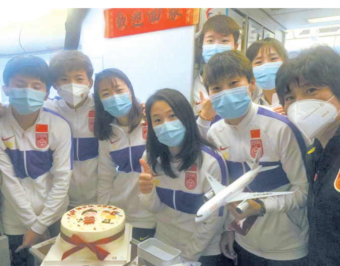
中国女足主教练水庆霞(右一)与部分队员在机舱内合影