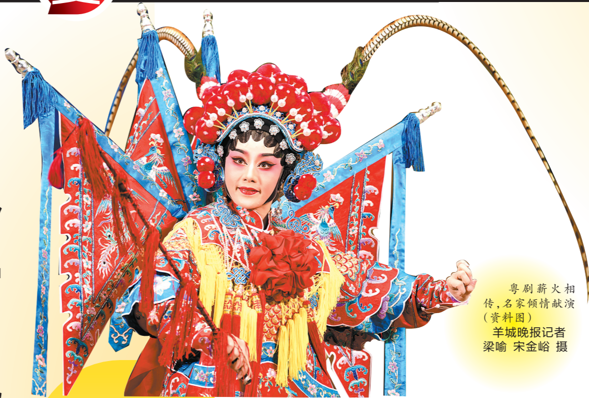
粤剧薪火相传,名家倾情献演(资料图)

近年来,广东牢记总书记殷殷嘱托,坚持文化自信,守正创新,为弘扬、传承和发展广东戏剧事业,以及广东文化强省建设贡献戏剧人的力量。