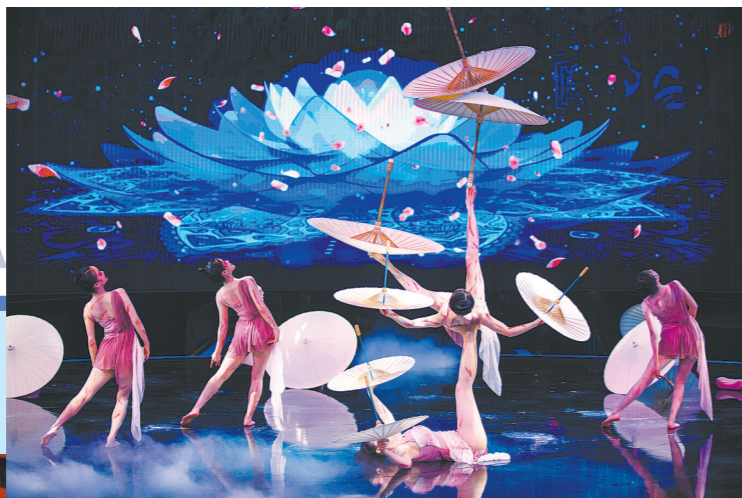
“玲珑五美”来自中国杂技团