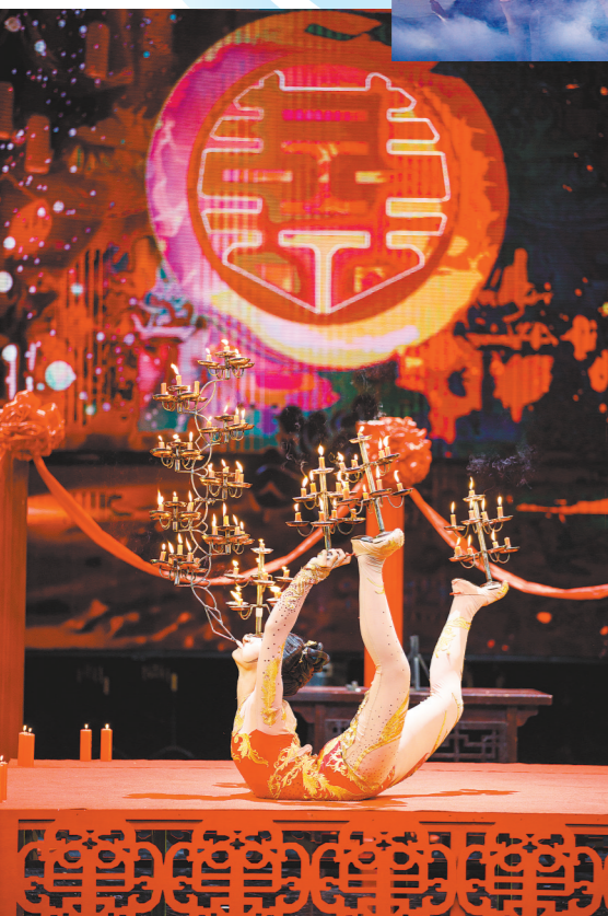
精彩节目尽显杂技魅力

同时，负责人表示，总局着力加强制度机制建设，积极推动电视剧行业规范化、标准化，“我们以‘找准选题、讲好故事、拍出精品’为主线，建立电视剧创作生产全流程质量管理体系，提高电视剧规划立项、剧本创作、拍摄制作、审查播出等各环节质量把控水平；建立电视剧创作生产告知承诺制度，在电视剧备案立项后和开拍前两个阶段，将内容、演员、片酬管理相关要求告知制作机构，制作机构作出相关承诺；制定发布《电视剧母版制作规范》行业标准，对电视剧母版时长、署名、图像、声音、字幕、封装格式、制作质量等进行技术量化和统一规范；开展编剧、导演、演员、制片人、经纪人培训，提升电视剧从业人员政治素质、业务素质，等等”。